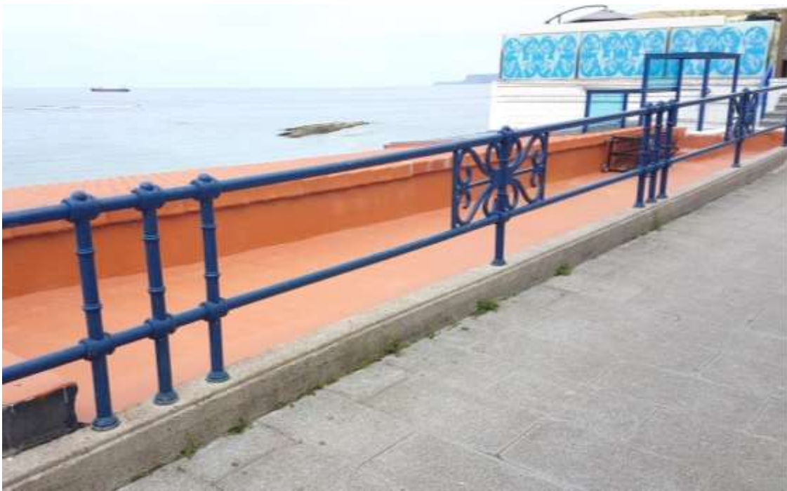
Detalles de las barandillas en la Avenida de Reina Victoria, a la altura de la playa y antiguo balneario de La Concha

A título comparativo, en la actualidad se están reparando, y en su caso sustituyendo, las barandillas de la Playa de La Concha en San Sebastián, por otras rigurosamente iguales a las originales. Las que se retiran son incluso sorteadas a vecinos de San Sebastián que lo solicitan, como gesto del aprecio al valor histórico y emocional que sienten los ciudadanos por las barandas originales.