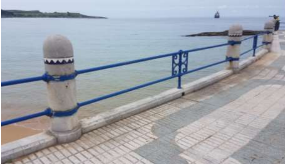
Barandillas originales que todavía existen en el borde de la playa de El Camello

Sin lugar a dudas, uno de los elementos más característicos de este proyecto fue el diseño del mobiliario urbano y las barandillas. Estas últimas se proyectan como una secuencia de pilonos cilíndricos de piedra caliza coronados con forma semiesférica. El espacio entre ellos se salva con una baranda compuesta con dos tubos metálicos superpuestos. En el centro del vano se sitúan uno o dos soportes de fundición, en donde se insertan los tubos en anillos-rosetones en forma de hembra en ambas direcciones. Desde este poste se despliega hacia ambos lados un adorno central de serpentinas terminadas con formas espirales.