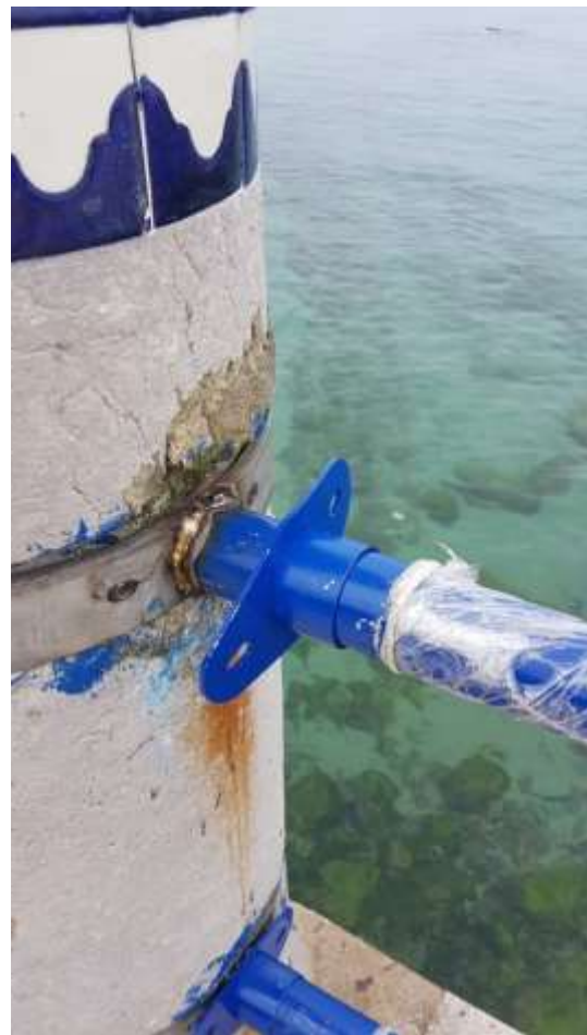
Fotos comparativas entre la pieza de fundición original donde se insertan los tubos, y el nuevo tapajuntas que tapanía la unión soldada, en el encuentro con los pilonos de piedra