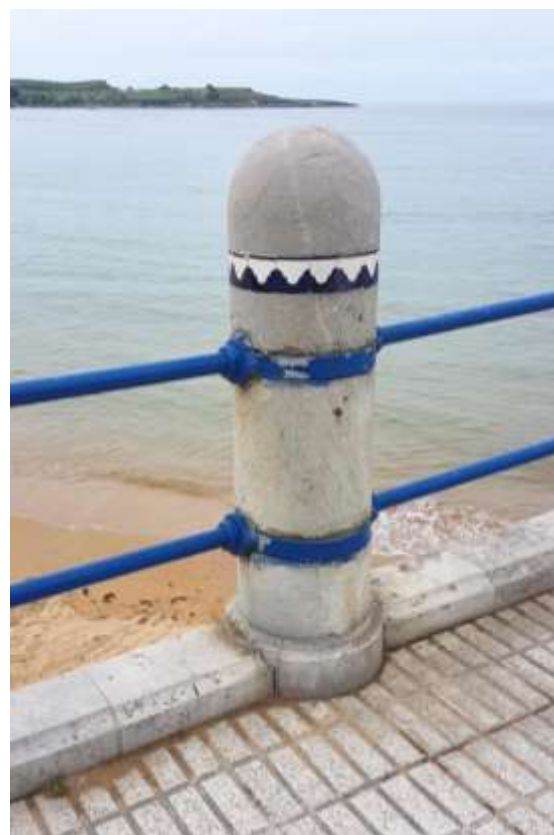
Aspecto característico de las barandillas originales