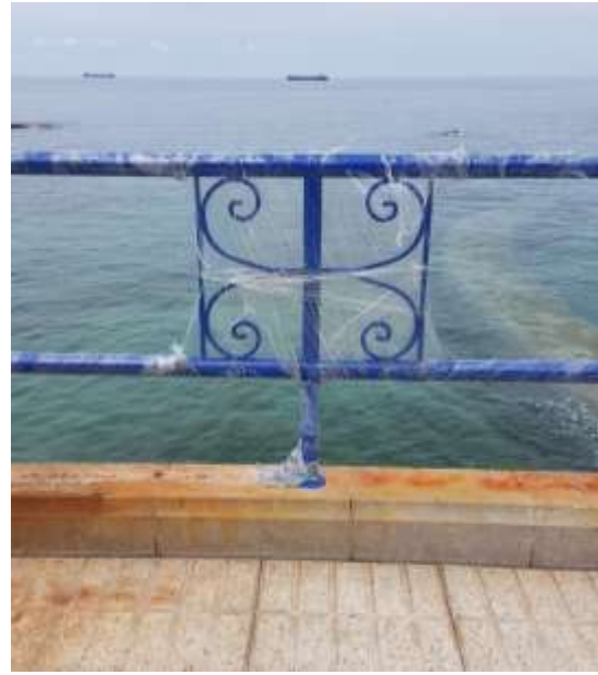
Fotos comparativas del elemento central de hierro fundido en la original, y la nueva barandilla realizada soldando los tubos. Se pueden comparar los adornos centrales.