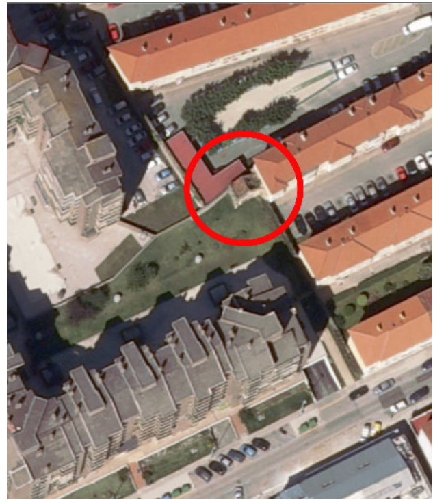
En el circulo, la capilla.