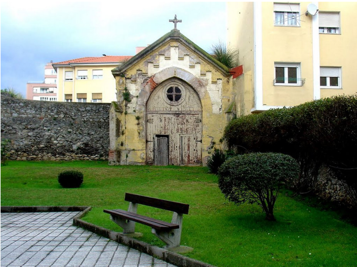
Capilla de las Salesas Reales en Santander

Yo hasta los 17 años pasaba los veranos en Alceda, un pueblo del Valle de Toranzo, al que me honro en pertenecer y considero mi cuna. Pues en uno de esos veranos siendo niño, un día observé como unos individuos del lugar al salir de un bar, daban una patada por sorpresa a un perruco que estaba durmiendo al sol. El susto del pobre perro fue monumental. Las risotadas y carcajadas, de los brutos, fueron monumentales. ¿Qué les había hecho el perro? pues nada, era para divertirse. Eso es falta de sensibilidad, es brutalidad pura. En algunas cosas hemos evolucionado a mejor, en otras no.