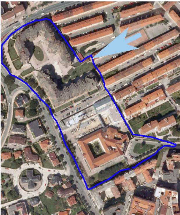
Contorno de la finca original de las Salesas Reales en Santander y localización de la capilla